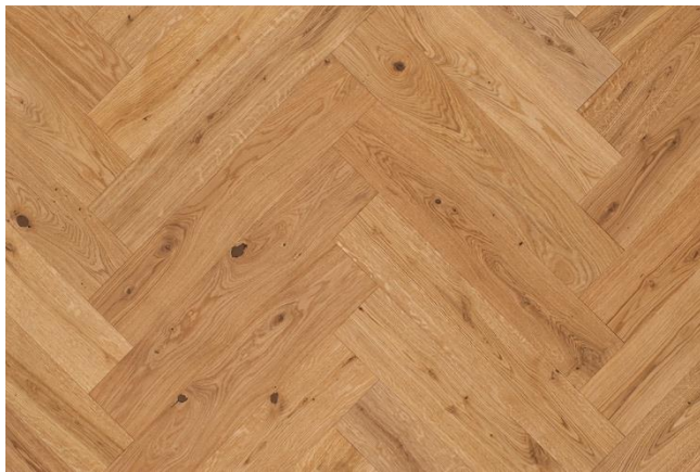
Eiche Markant (Abbildung 90°)