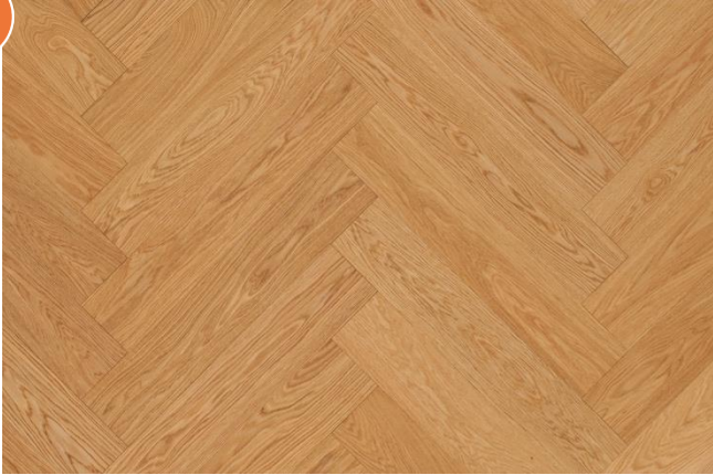
Eiche Eleganz (Abbildung 90°)