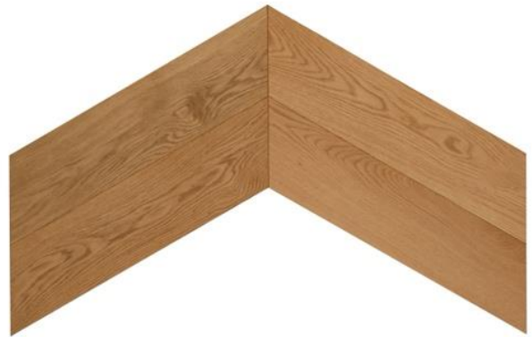
Fischgrät Winkel 60°

Das Naturprodukt Holz ist einzigartig in seiner Form und Beschaffenheit. Struktur- und Farbunterschiede unterstreichen seine Individualität und stellen keinen Mangel dar. Mit unserer langjährigen Erfahrung und der Liebe zum Holz sind wir stets bestrebt Ihnen ein einwandfreies Produkt zu liefern. Gänzlich können wir vereinzelt Sortier- und Produktionsfehler nicht ausschließen, welche