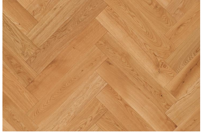
Eiche Natur (Abbildung 90°)